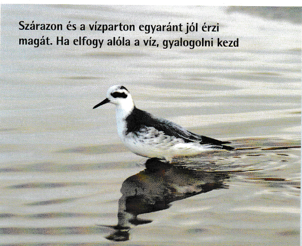
Szárazon és a vízparton egyaránt jól érzi magát. Ha elfogy alóla a víz, gyalogolni kezd