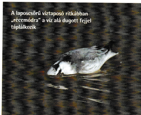
A laposcsőrű víztaposó ritkábban „récemódra” a víz alá dugott fejjel táplálkozik