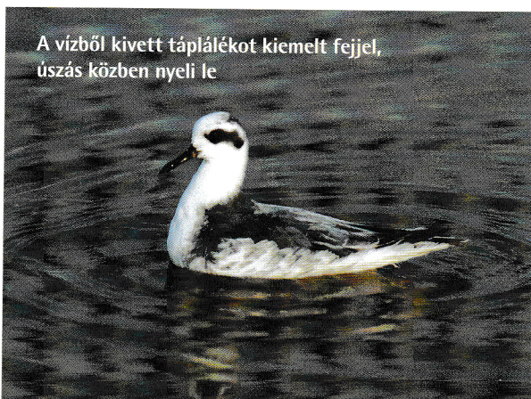
A vízből kivett táplálékot kiemelt fejjel, úszás közben nyeli le

Egy éven át madártani terepmunkát végeztem a Kiskunság élőhely-rekonstrukciós LIFE-programjával kapcsolatban, a Böddi-széken. Ennek során, nem sokkal a beruházás megkezdése után figyeltem fel arra, hogy máris olyan vendégünk van, amelyből évenként legfeljebb egy-két példányt figyelhetnek meg hazánkban. Laposcsőrű víztaposó kalandozott a hullámozó vízben.