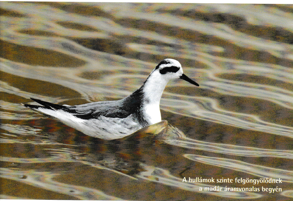
A hullámok szinte felgöngyölödnek a madár áramvonalas begyén

ÍRTA ÉS FÉNYKÉPEZTE | DR. BANKOVICS ATTILA, zoológus-ornitológus