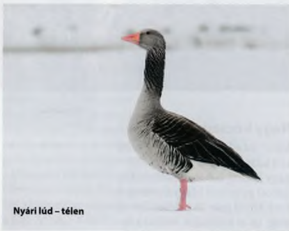
Nyári lúd – télen